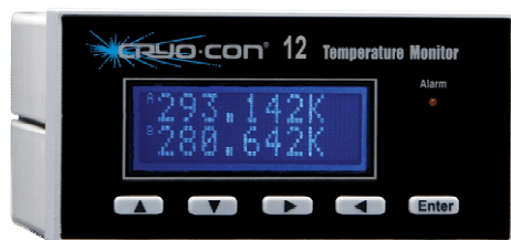
12 温度监视器前面板